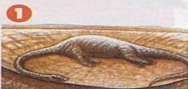
1 Il y a 150 millions d'années, cet Apatosaurus est tombé dans une mare de boue et il est mort.