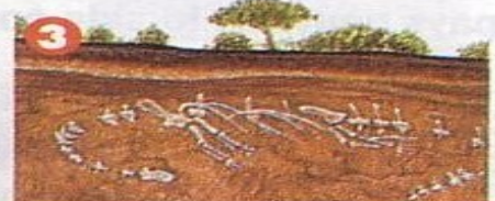
3 Petit à petit, le squelette a été recouvert par des couches de poussière et de boue.

Images Doc n°99, Mars 1997, © Bayard Presse