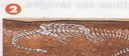
2 Très vite, la chair du dinosaure a disparu, mais son squelette, plus dur, a résisté.