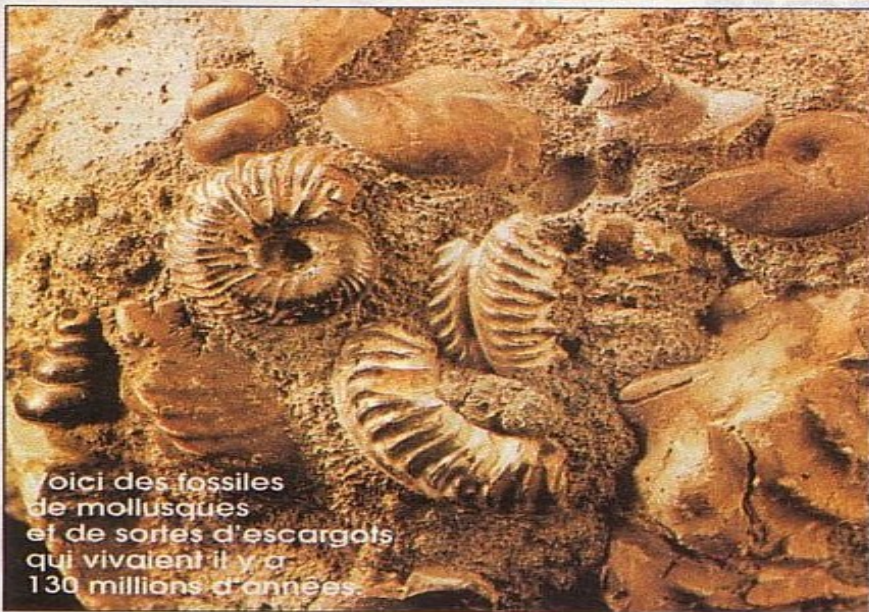
Voici des fossiles de mollusques et de sortes d'escargots qui vivaient il y a 130 millions d'années.