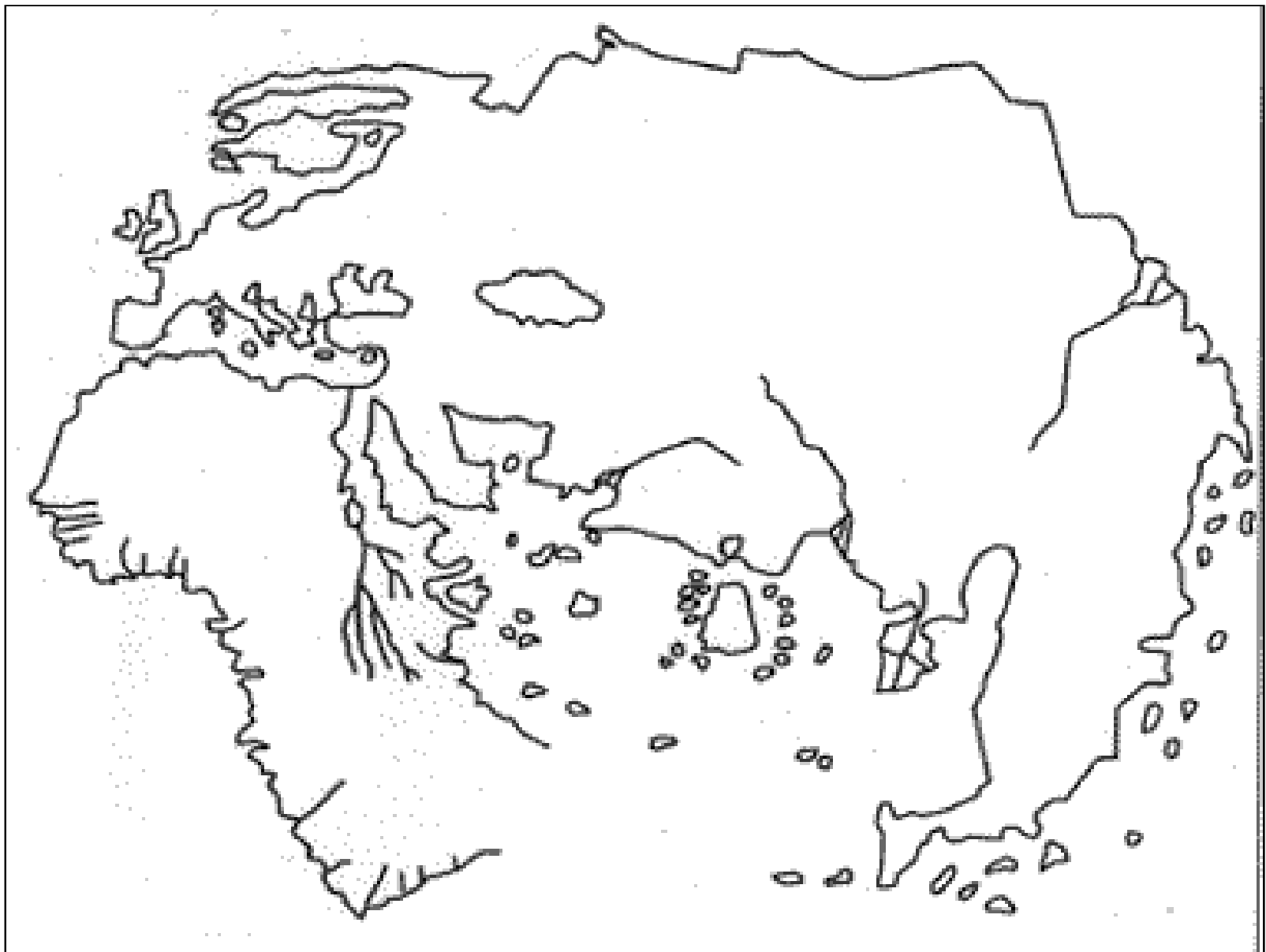
Document 1 : Mappemonde d'H. Martellus - vers 1489