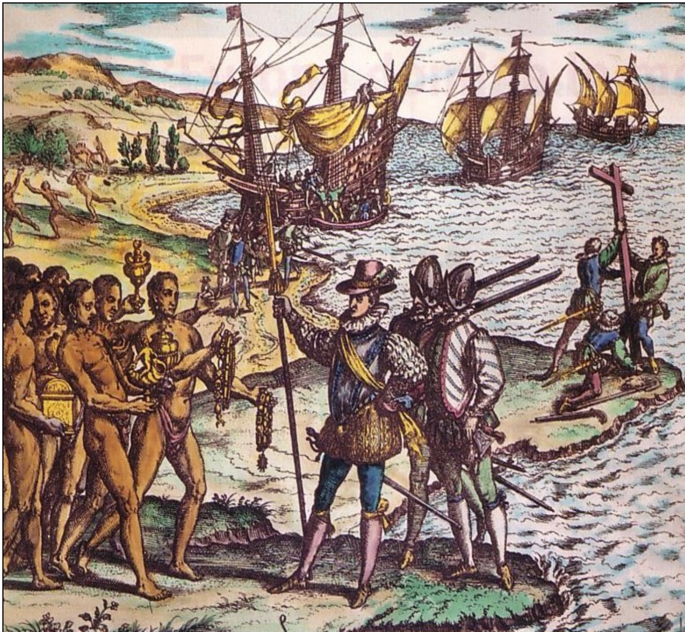
Document 6 : Arrivée de Christophe Colomb en Amérique - gravure - XVI e (16 e ) siècle.