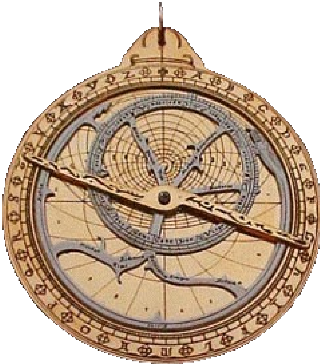
Document 3 : Astrolabe