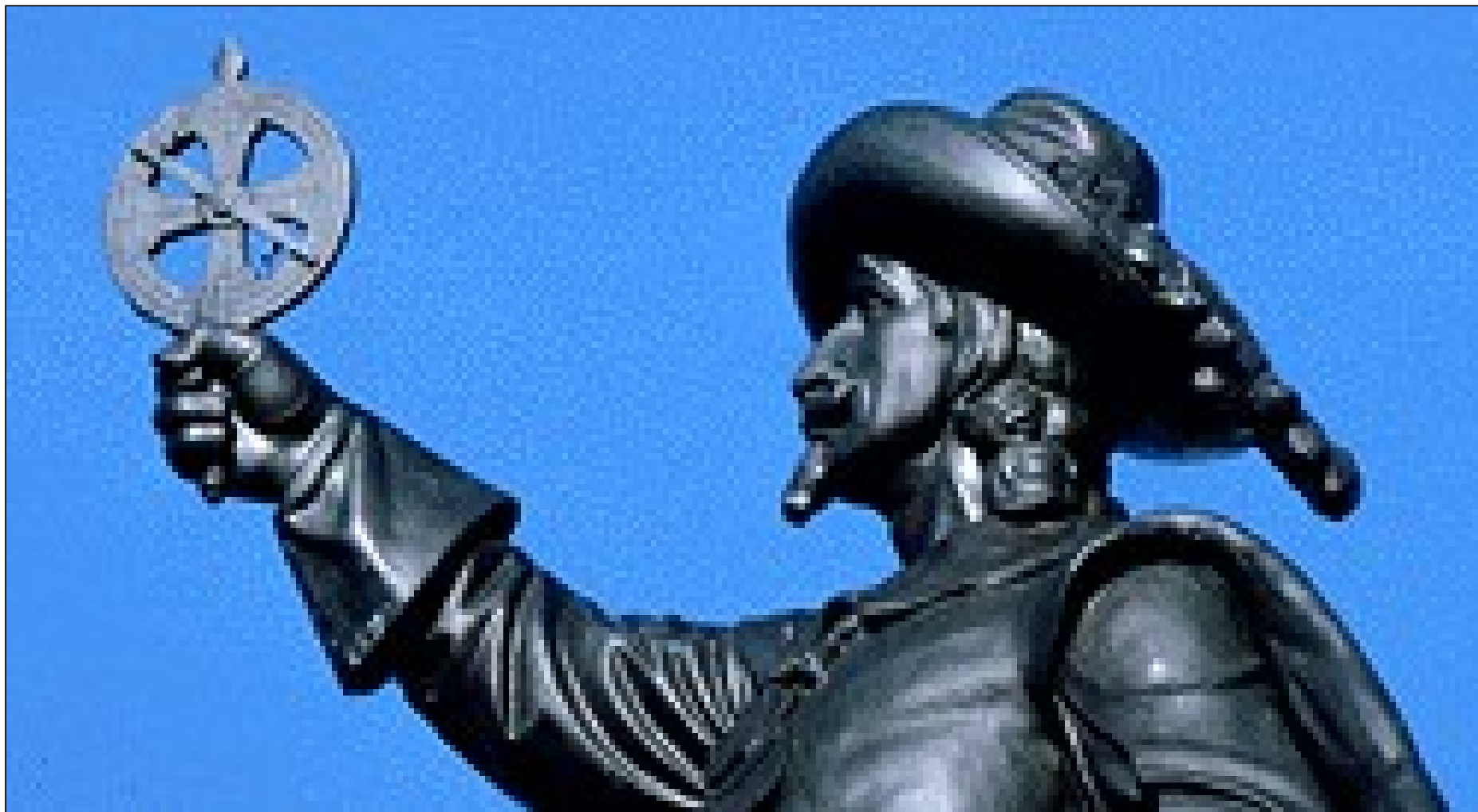
Document 2 : Statue d'un navigateur du XVI e (16 e ) siècle - Canada