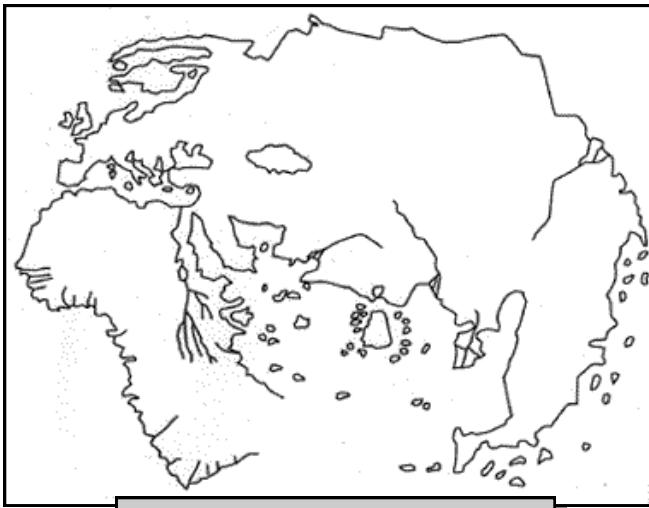
Document 1 : Mappemonde d'H. Martellus - vers 1489