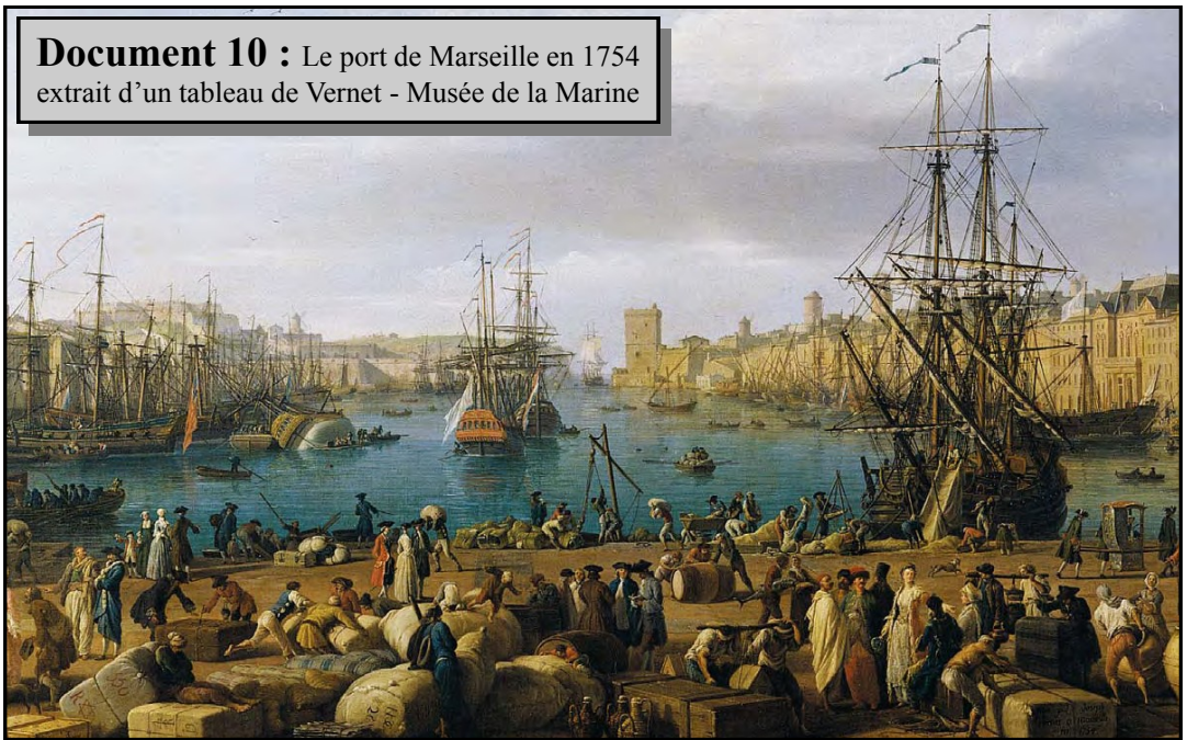
Document 10 : Le port de Marseille en 1754 extrait d'un tableau de Vernet - Musée de la Marine