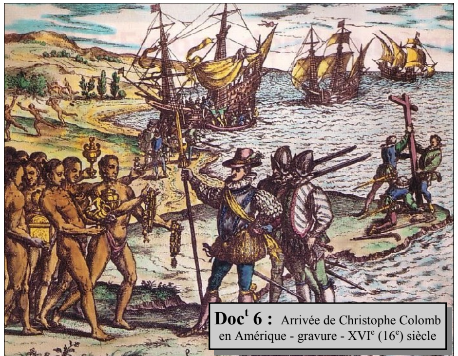
Doc t 6 : Arrivée de Christophe Colomb en Amérique - gravure - XVI e (16 e ) siècle