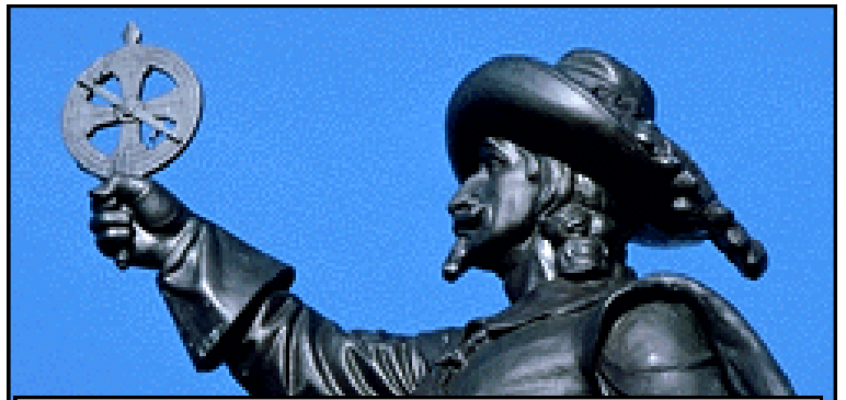
Document 2 : Statue d'un navigateur du 16 e siècle - Canada