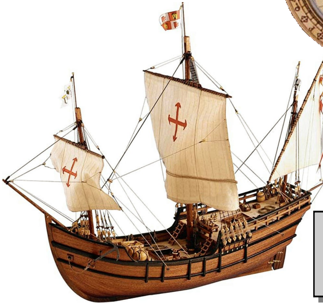
Document 4 : maquette de la Pinta (caravelle de Christophe Colomb)