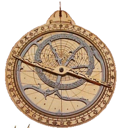
Document 3 : Astrolabe

mai 2006 - dernières modifications en juillet 2014