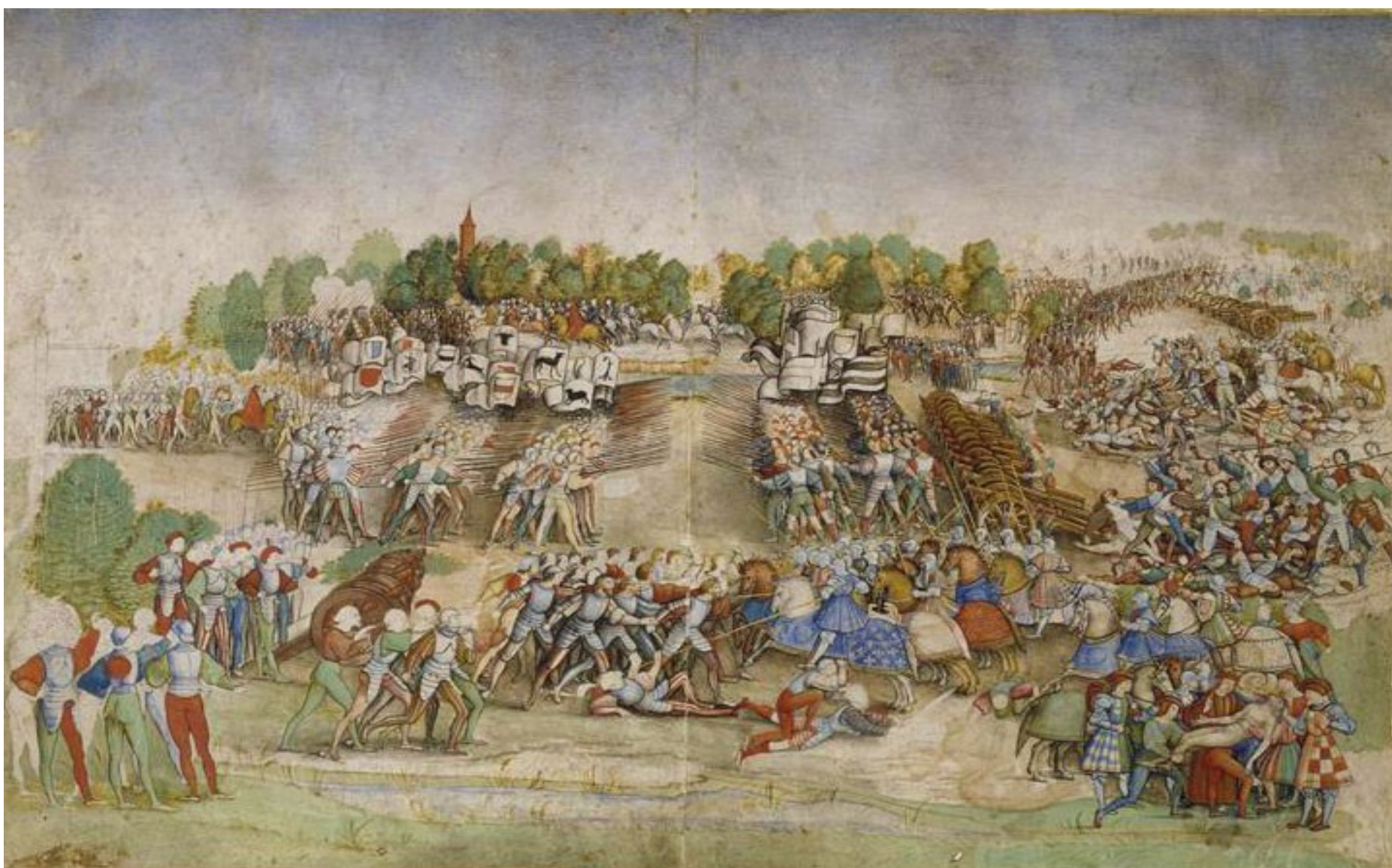
Document 5 : bataille de Marignan (dessin à l'aquarelle) - Maître de la Ratière - musée Condé de Chantilly - 1515