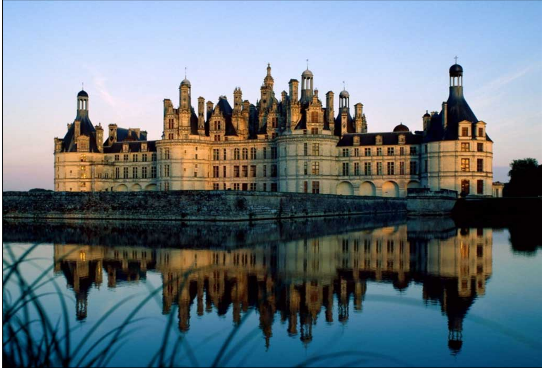
Document 9 : château de Chambord - 1519-1537 - Loir-et-Cher