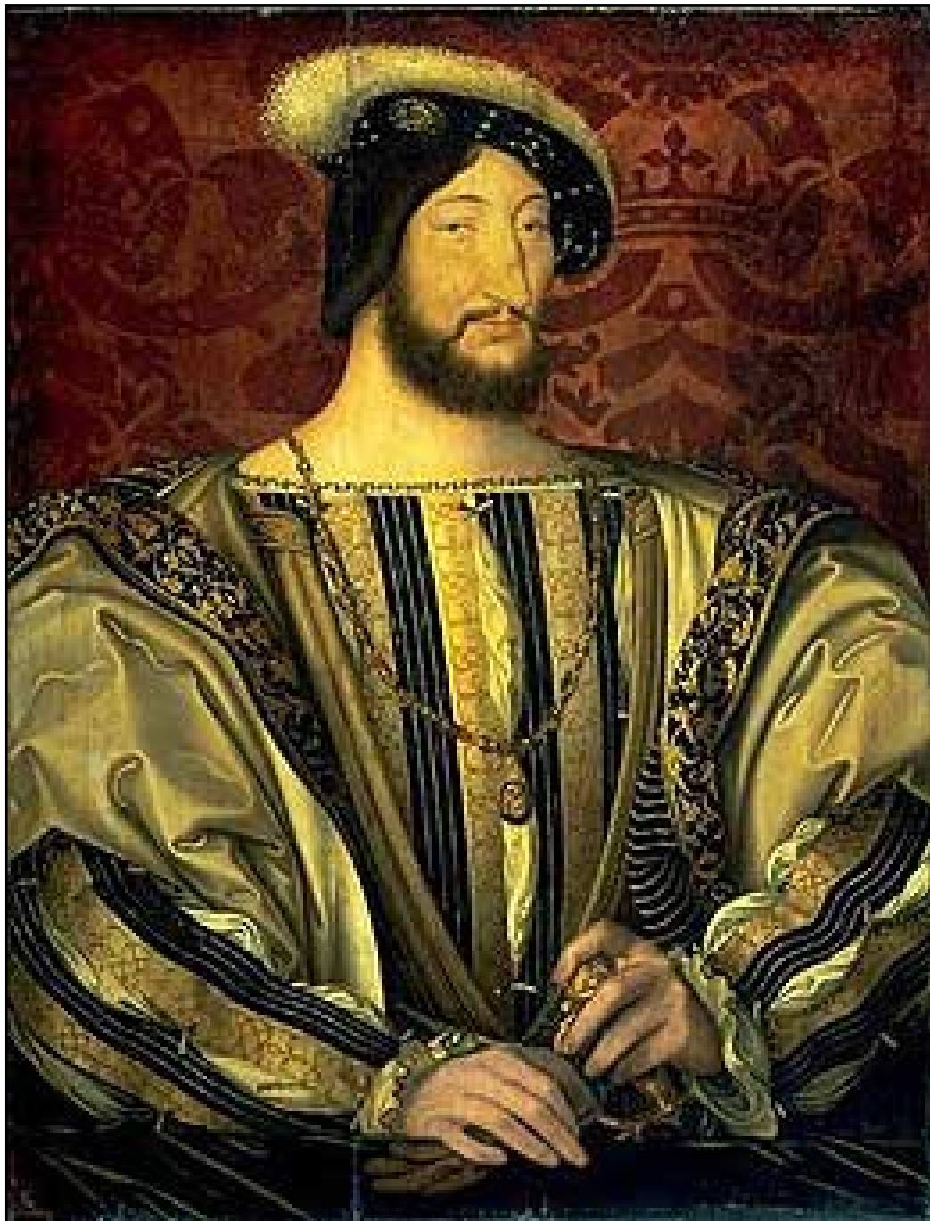
Document 7 : Portrait de François 1 er - Jean Clouet - 1520 Musée du Louvre (Paris)