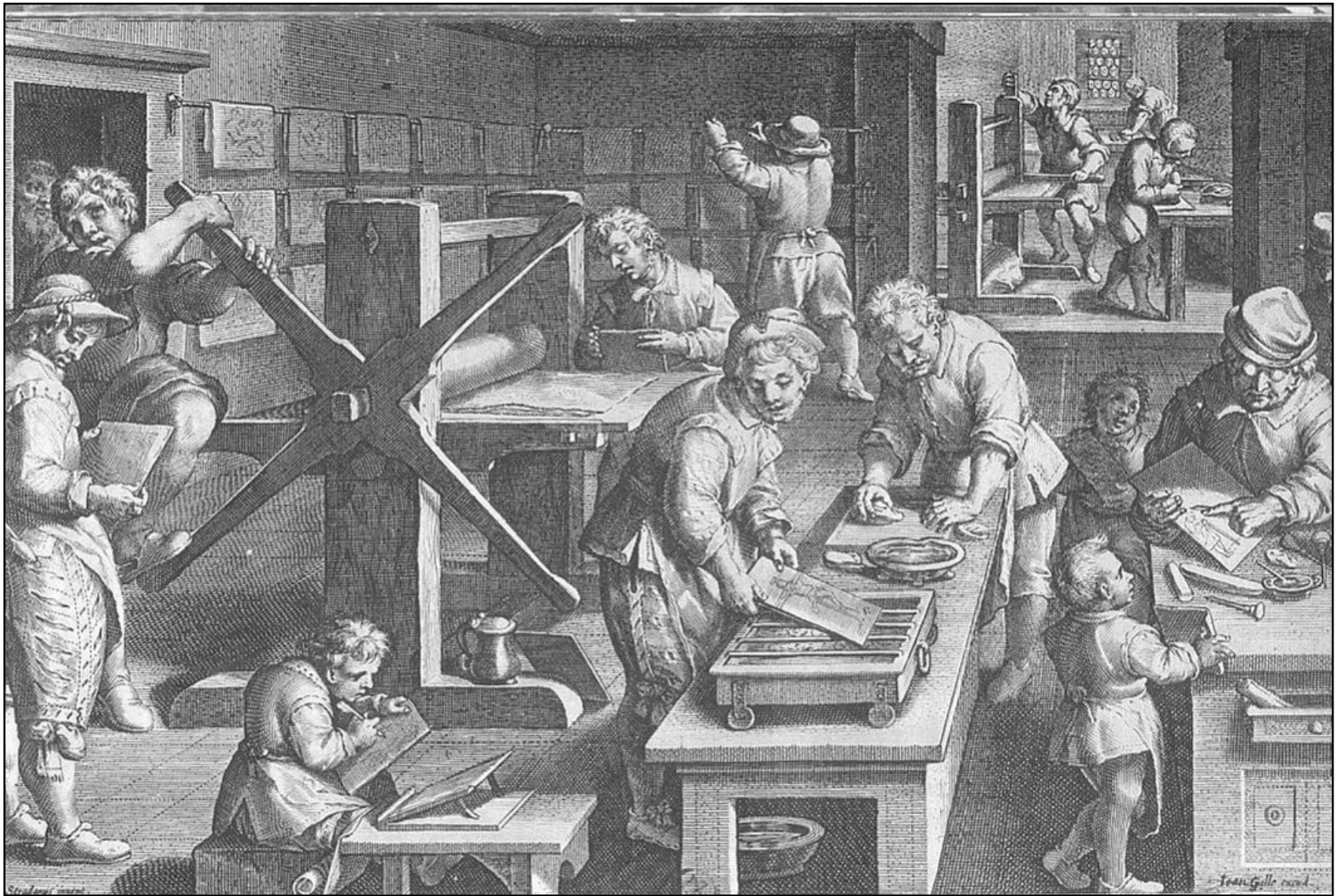
Document 3 : Imprimerie au XVI e (16 e ) siècle Hans Collaert - gravure - BNF Paris