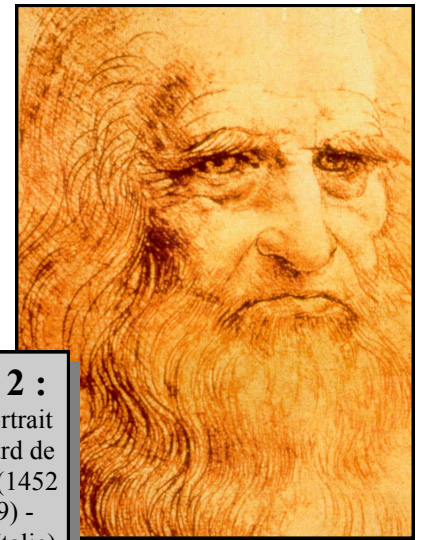
Doc t 2 : Autoportrait - Léonard de Vinci - (1452 - 1519) - Turin (Italie)