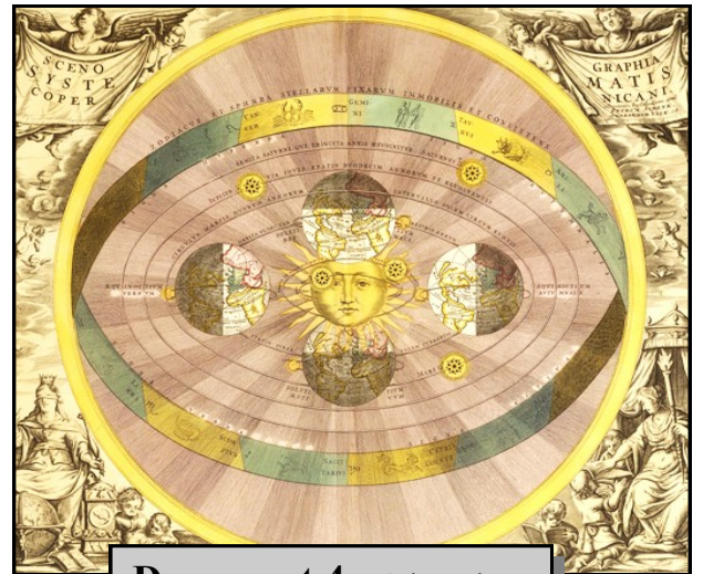
Document 4 : Atlas céleste de Nicolas Copernic - 1543