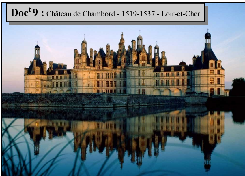
Doc t 9 : Château de Chambord - 1519-1537 - Loir-et-Cher

mai 2006 - dernières modifications en juillet 2014