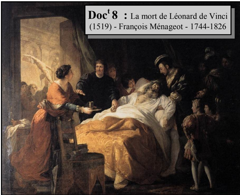
Doc t 8 : La mort de Léonard de Vinci (1519) - François Ménageot - 1744-1826