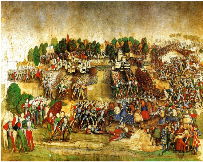
Document 5 : Décris ce dessin à l'aquarelle.