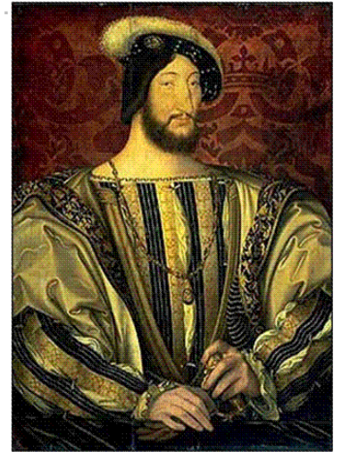
Document 7 : Décris François 1 er (visage - attitude - vêtements)