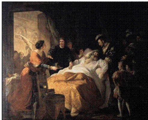
Document 8 : Quels personnages repères-tu sur ce tableau ?

Qu'est-ce qui montre l'importance de l'homme qui meurt ?