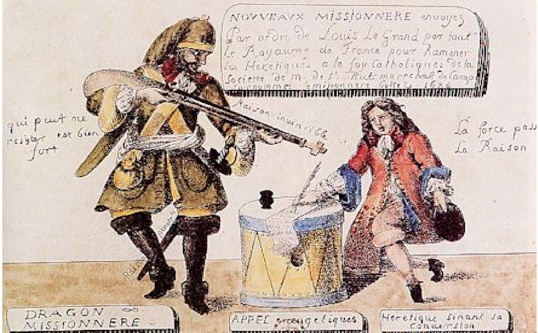
Doc t 8 : Les dragonnades, ou la conversion forcée des protestants après l'annulation de l'Édit de Nantes - illustration lithographie - Engelmann - B.N.