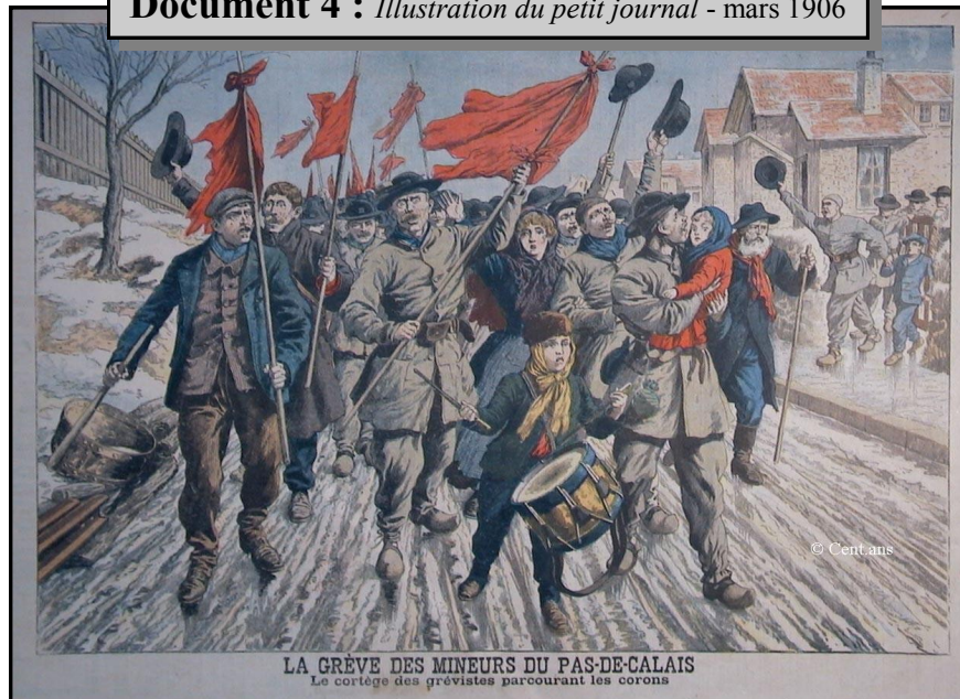
LA GRÈVE DES MINEURS DU PAS-DE-CALAIS Le cortège des grévistes parcourant les coronas