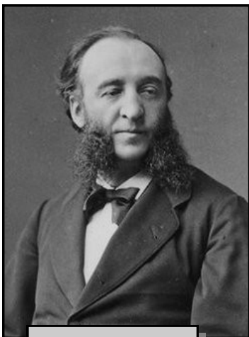
Document 8 : Jules Ferry (1832-1893)

Document 9 : « Le tour de France par deux enfants » - G Bruno - 1877