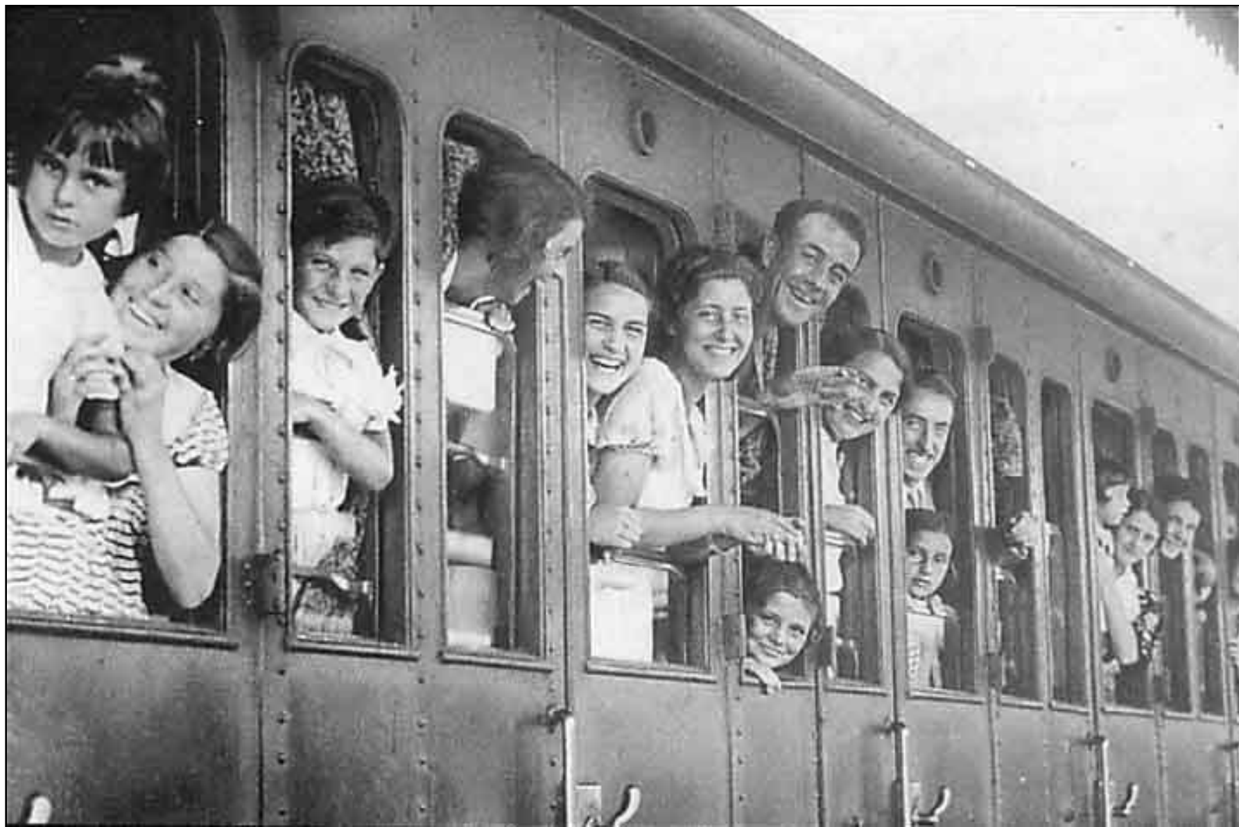
Doc t 5 : les premiers congés payés de 1936