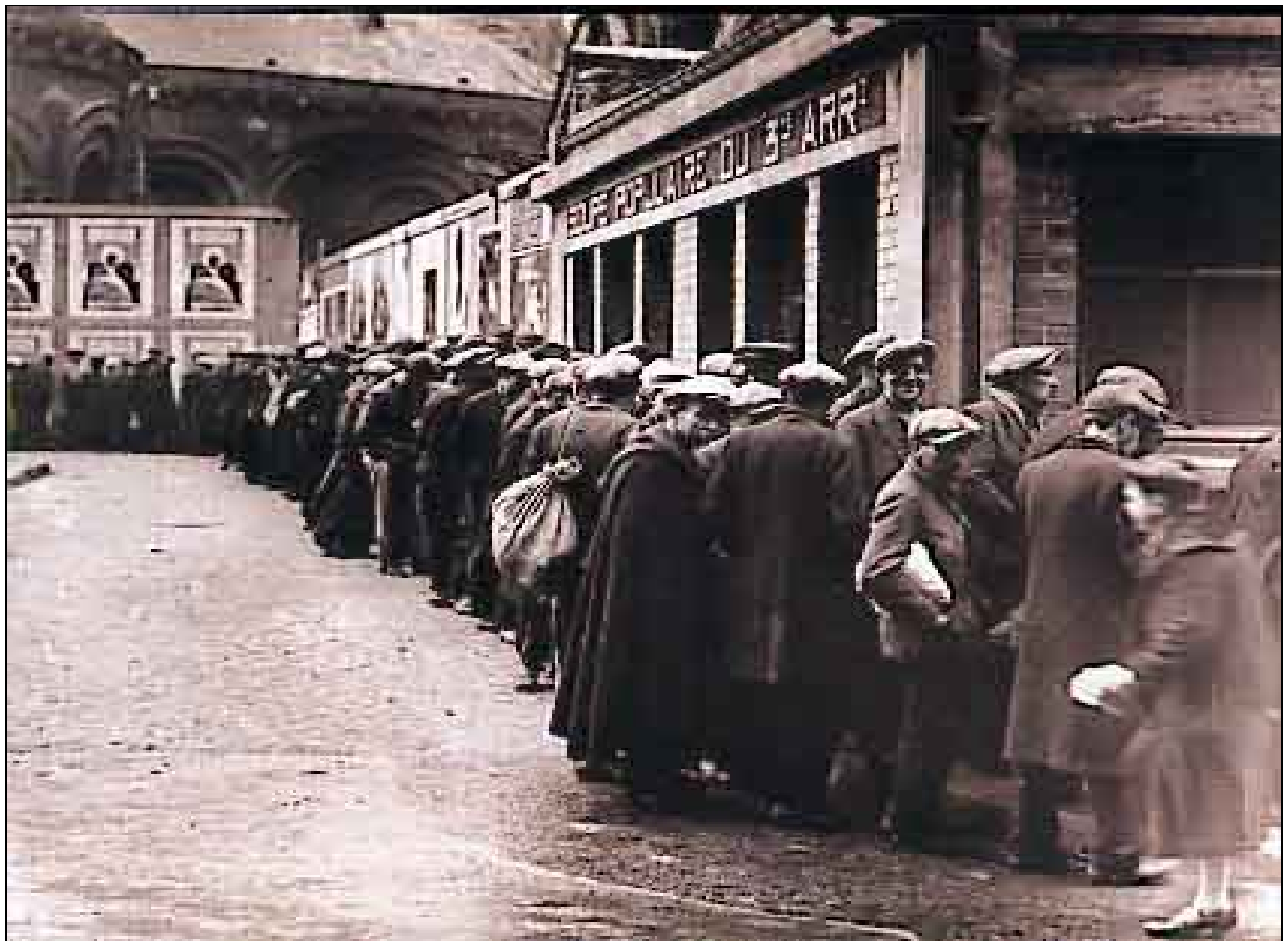
Doc t 4 : Soupe populaire - 1935