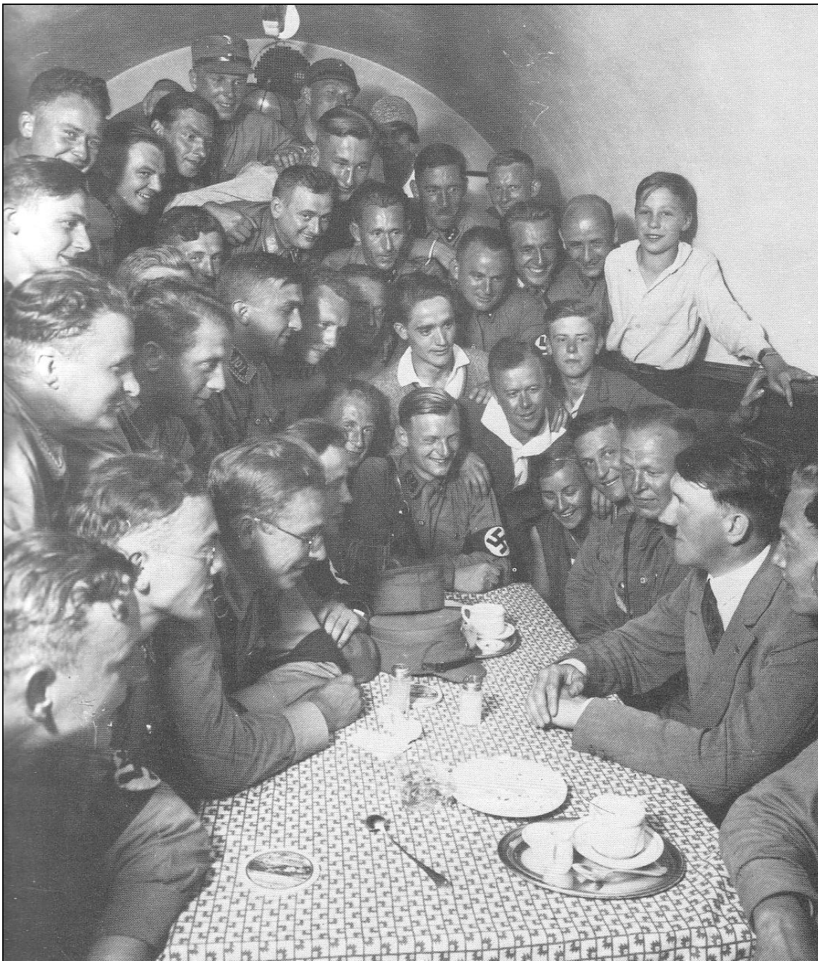
Doc t 7 : Un groupe autour du «Führer » -Munich