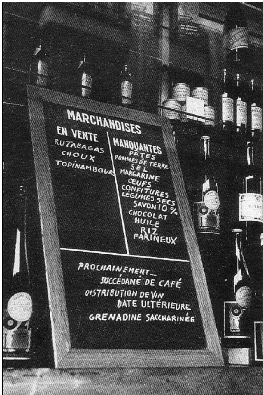
Document 9 : Photo prise dans un magasin d'alimentation