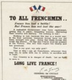
Document 3 : Appel du 18 juin 1940

QUARTIER-GÉNÉRAL, 4, CARLTON GARDENS, LONDON, S.W.1