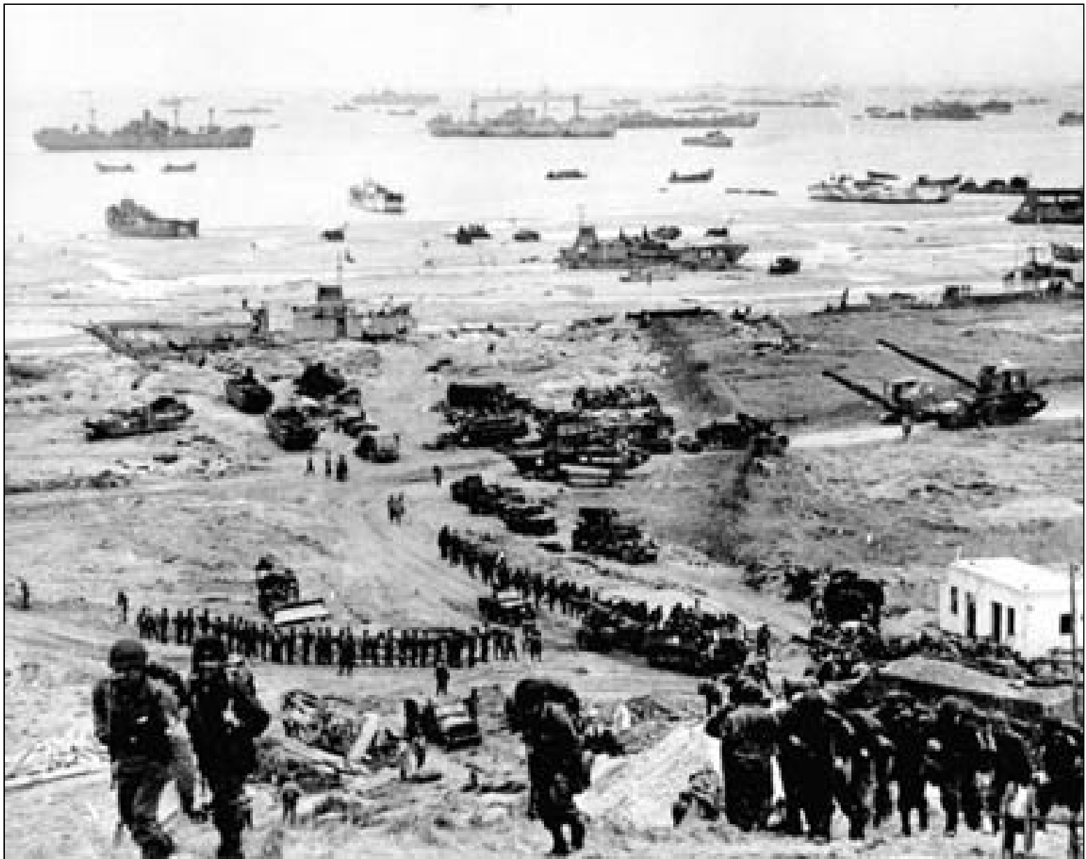
Document 12 : 6 juin 1944 - débarquement en Normandie.