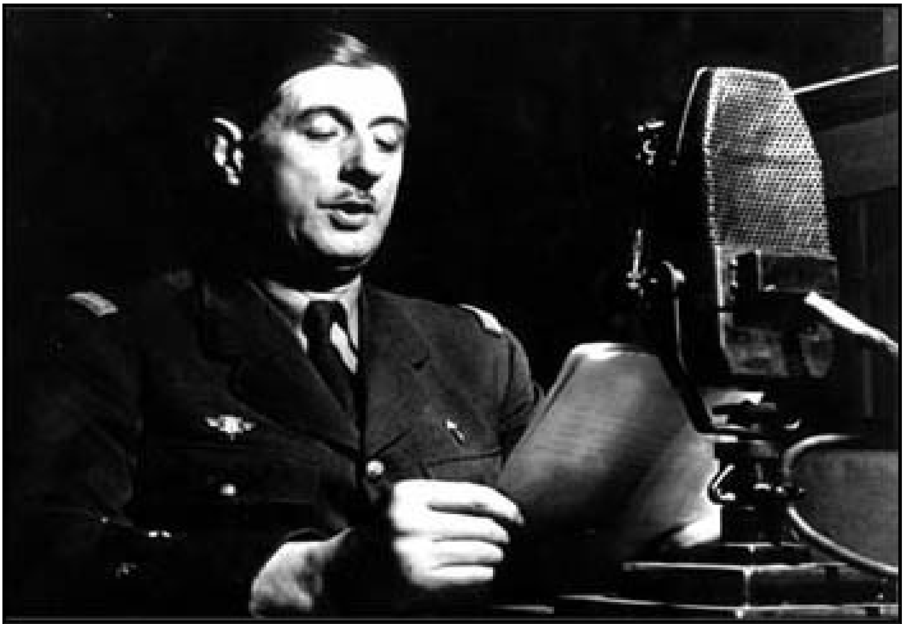
Document 2 : Le général De Gaulle en 1941.