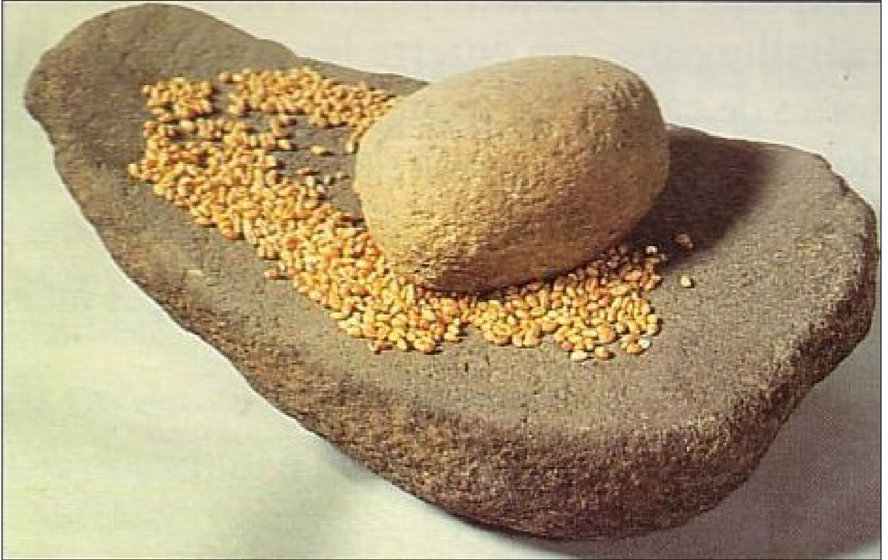
Document 1 : Meule à main en pierre, 4000 à 3000 av. J.C. ; Finistère (Bretagne).