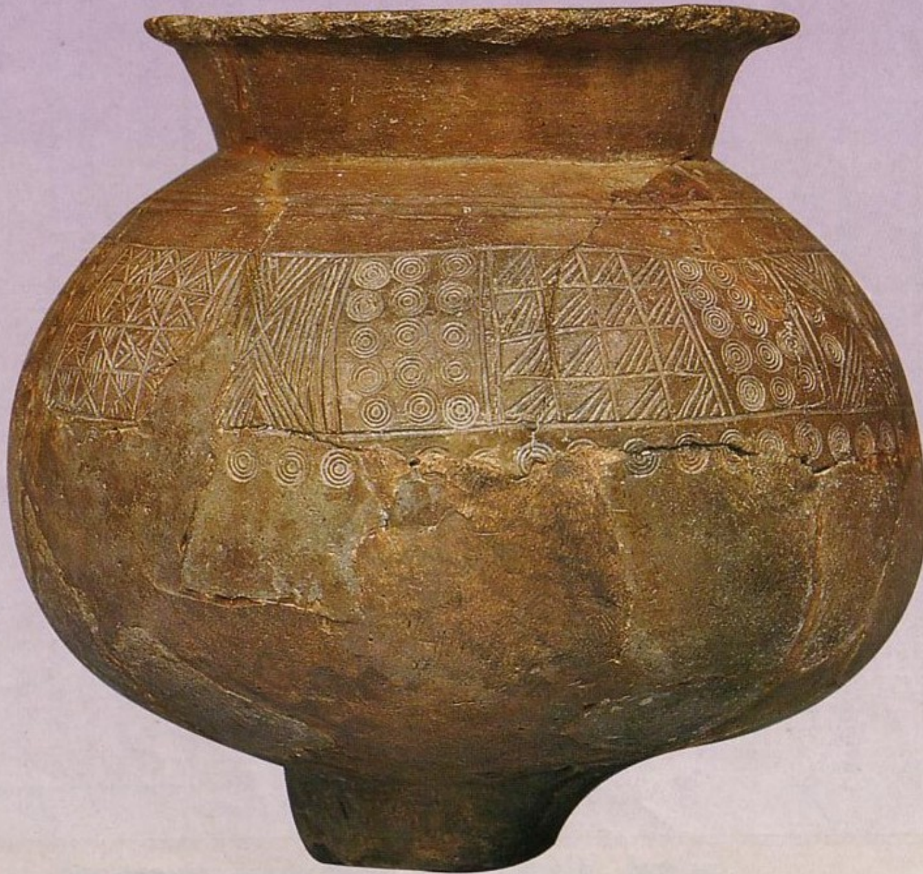
Document 4 : Poterie du Néolithique Grotte de Rancogne ; Charente (Poitou Charente) ; 2000 à 750 av. J.C.