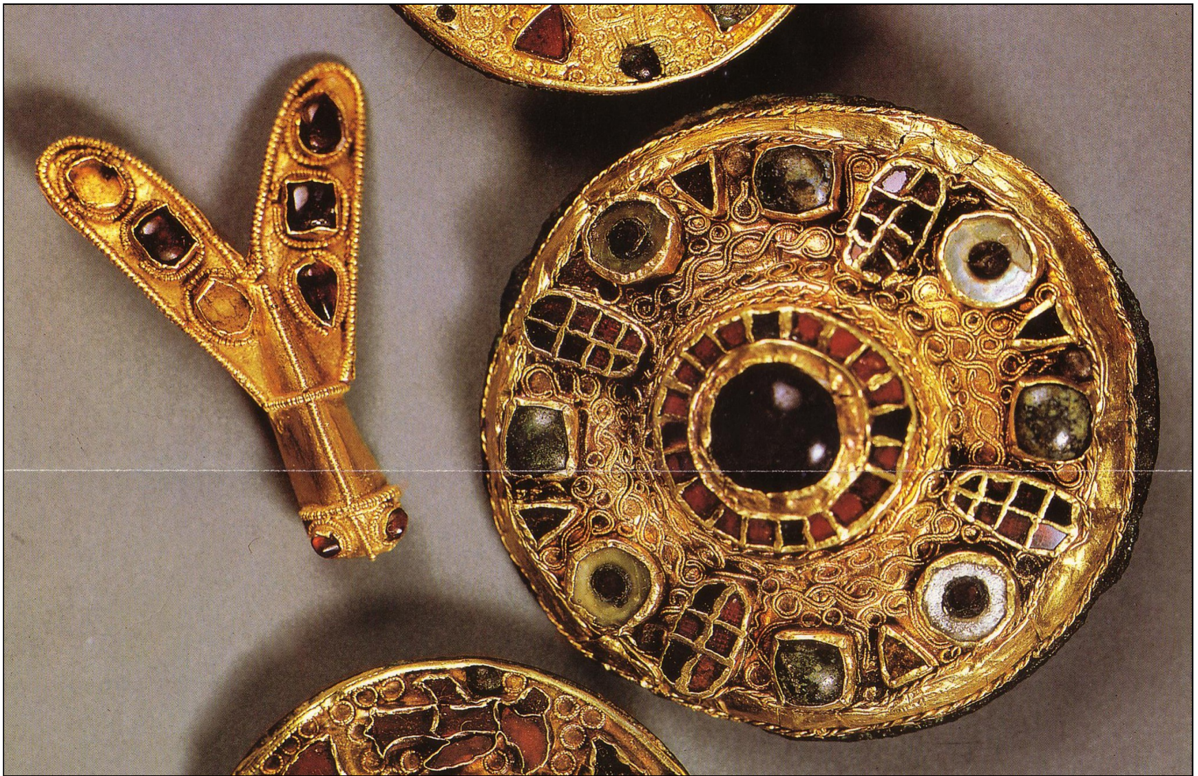
Document 11 : bijoux mérovingiens, épingle et boucle de ceinture - VI e VII e