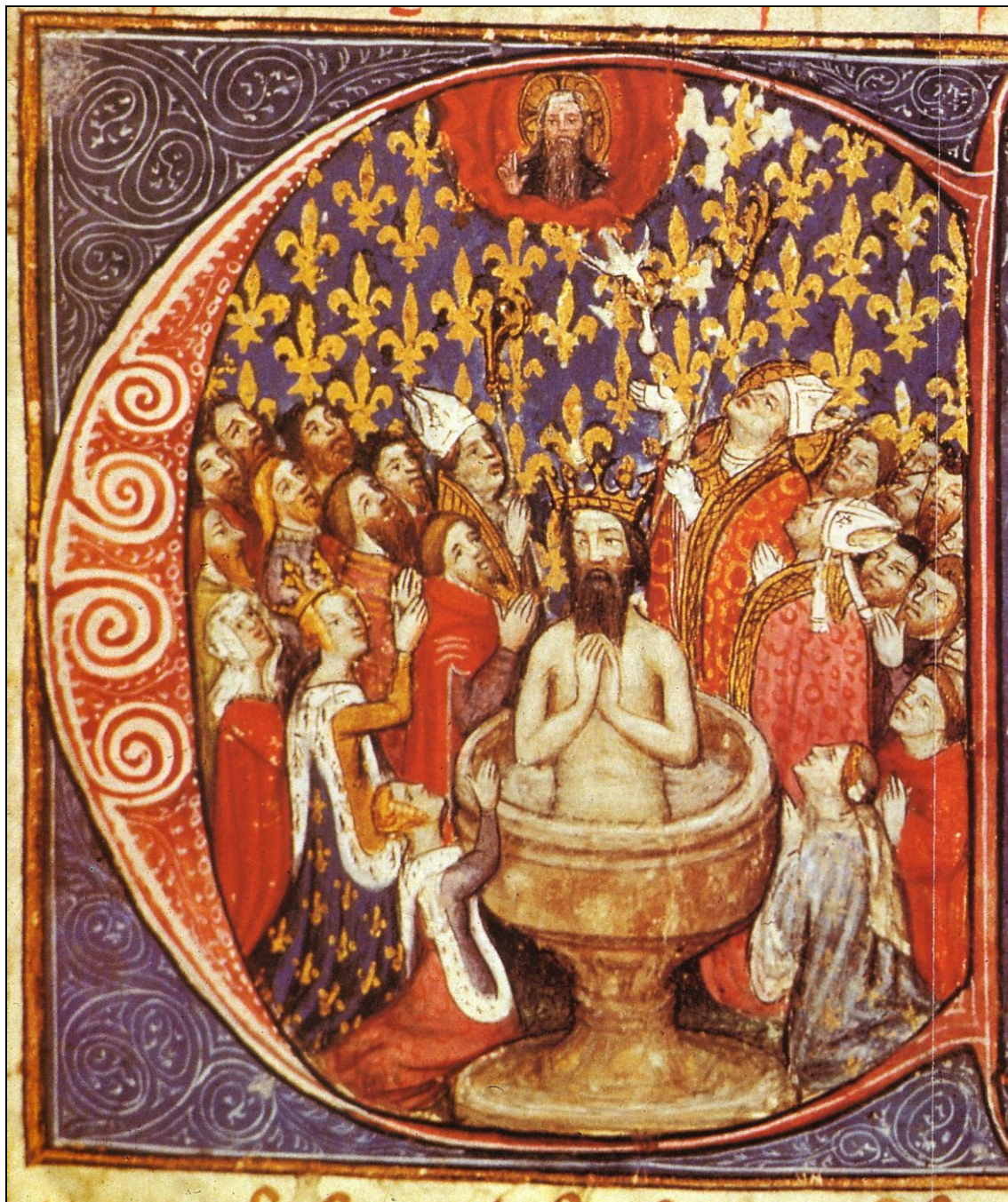
Document 10 : Baptême de Clovis - miniature extraite des « Grandes chroniques de France » -XV e siècle