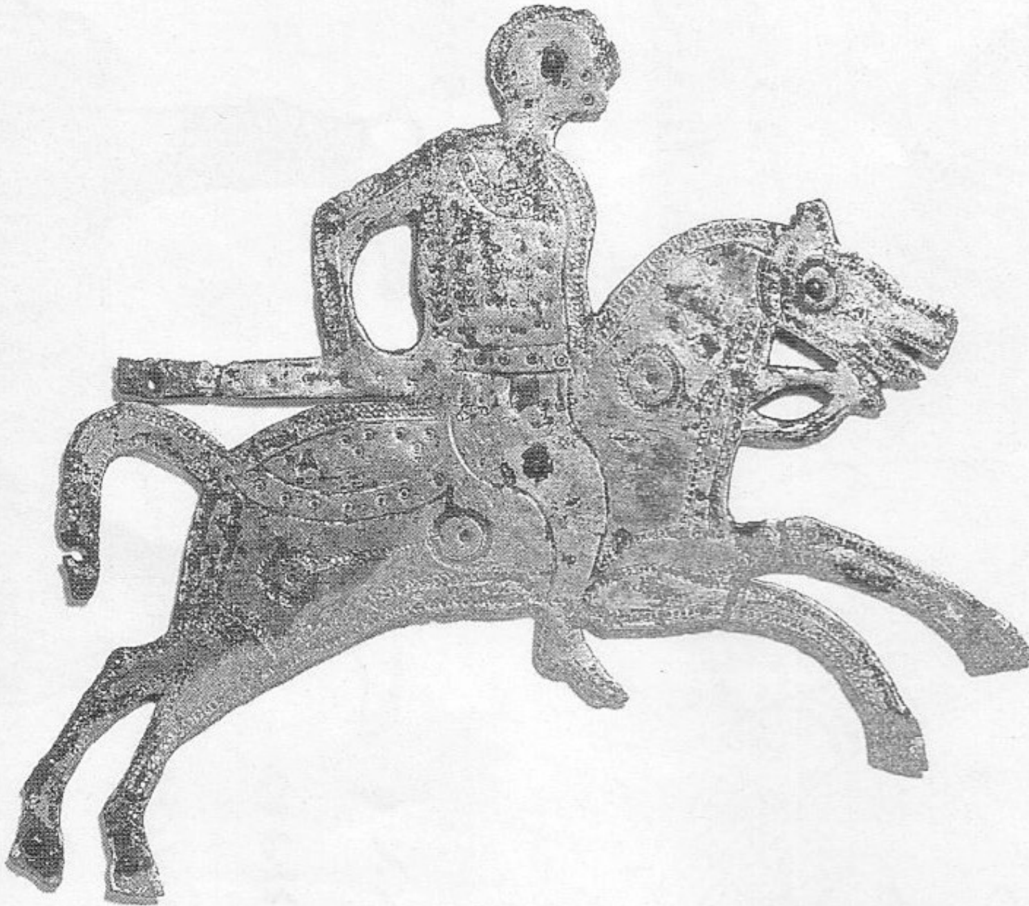
Doc t 5 : Plaque de garniture d'un bouclier mérovingien - VII e siècle