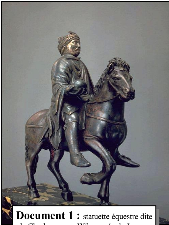
Document 1 : statuette équestre dite de Charlemagne - IX e - musée du Louvre