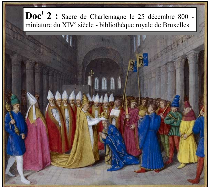
Doc t 2 : Sacre de Charlemagne le 25 décembre 800 - miniature du XIV e siècle - bibliothèque royale de Bruxelles