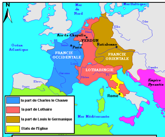
Doc t 8 : Partage de Verdun - 843 - carte de Alain Hout

Doc t 7 : Instruction de Charlemagne - début du IX e siècle.