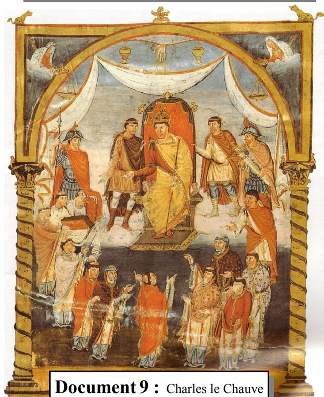
Document 9 : Charles le Chauve sur son trône - IX e siècle - BnF

Document 10 : Récit d'un religieux - IX e siècle