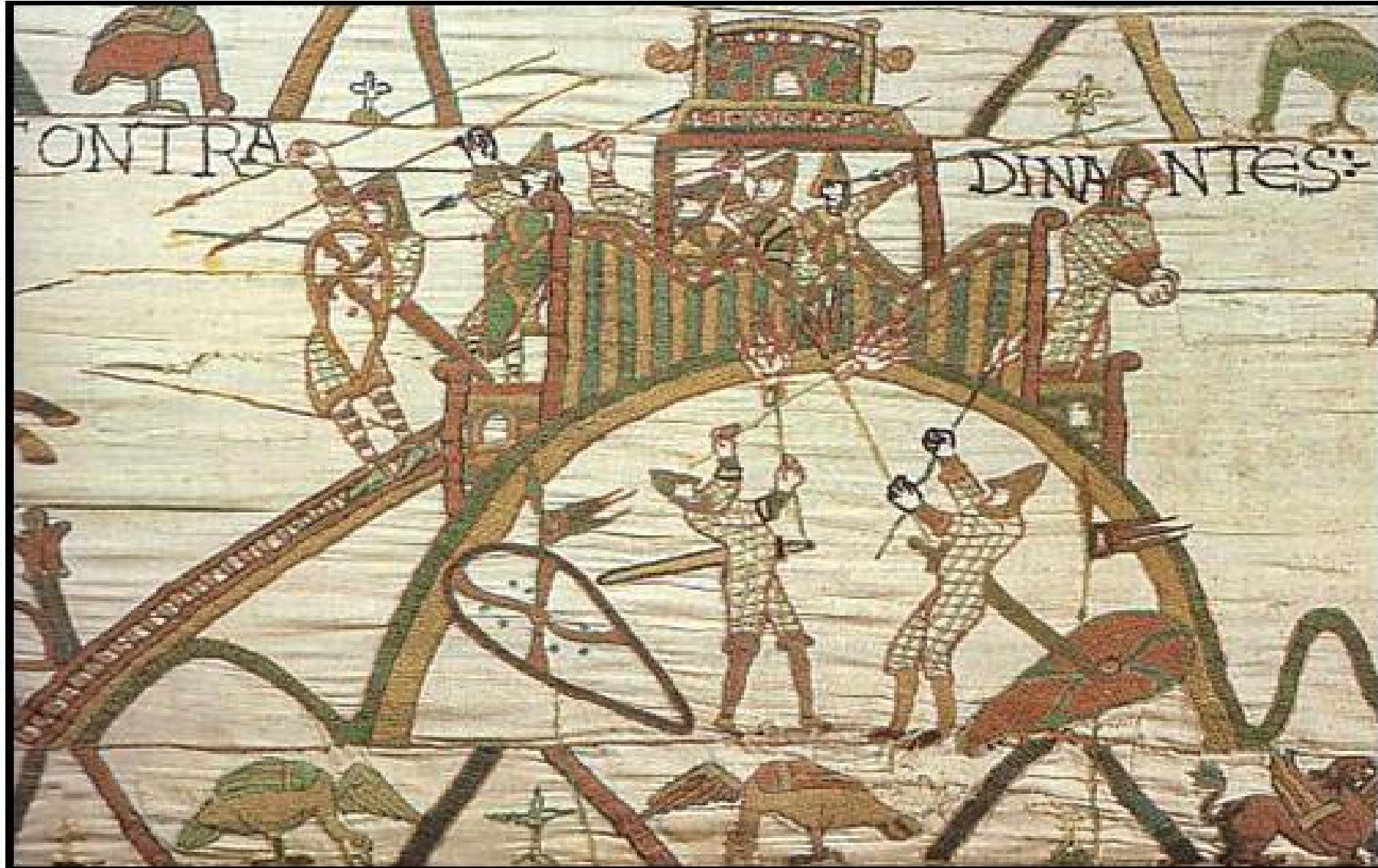
Document 2 : Motte féodale de Dinan - morceau de la tapisserie de Bayeux - XI e siècle