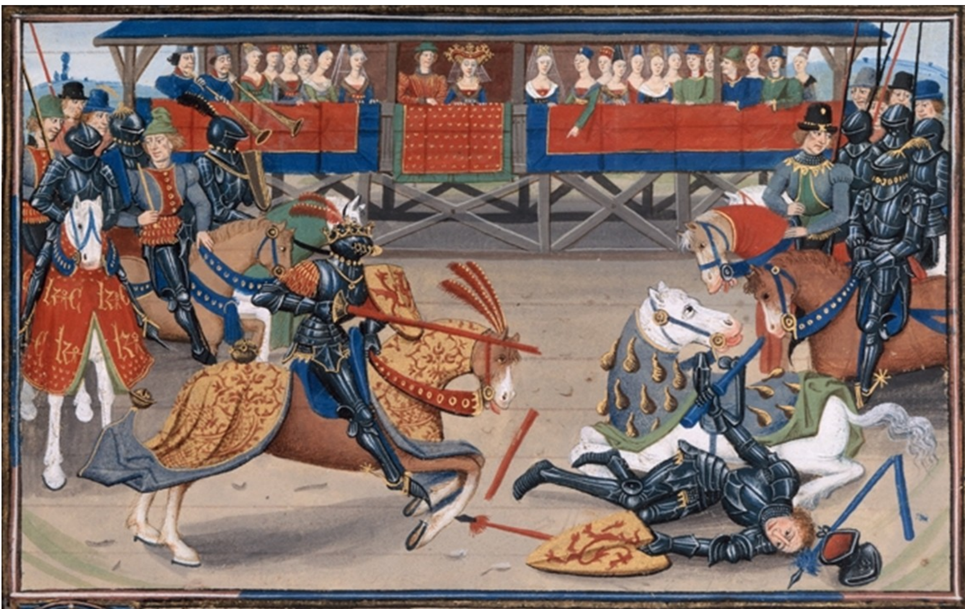
Document 6 : tournoi – enluminure – Bnf - XV e s.