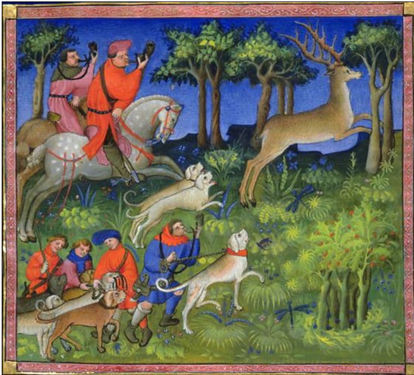
Document 5 : livre de chasse Gaston Phebus - XIV e siècle