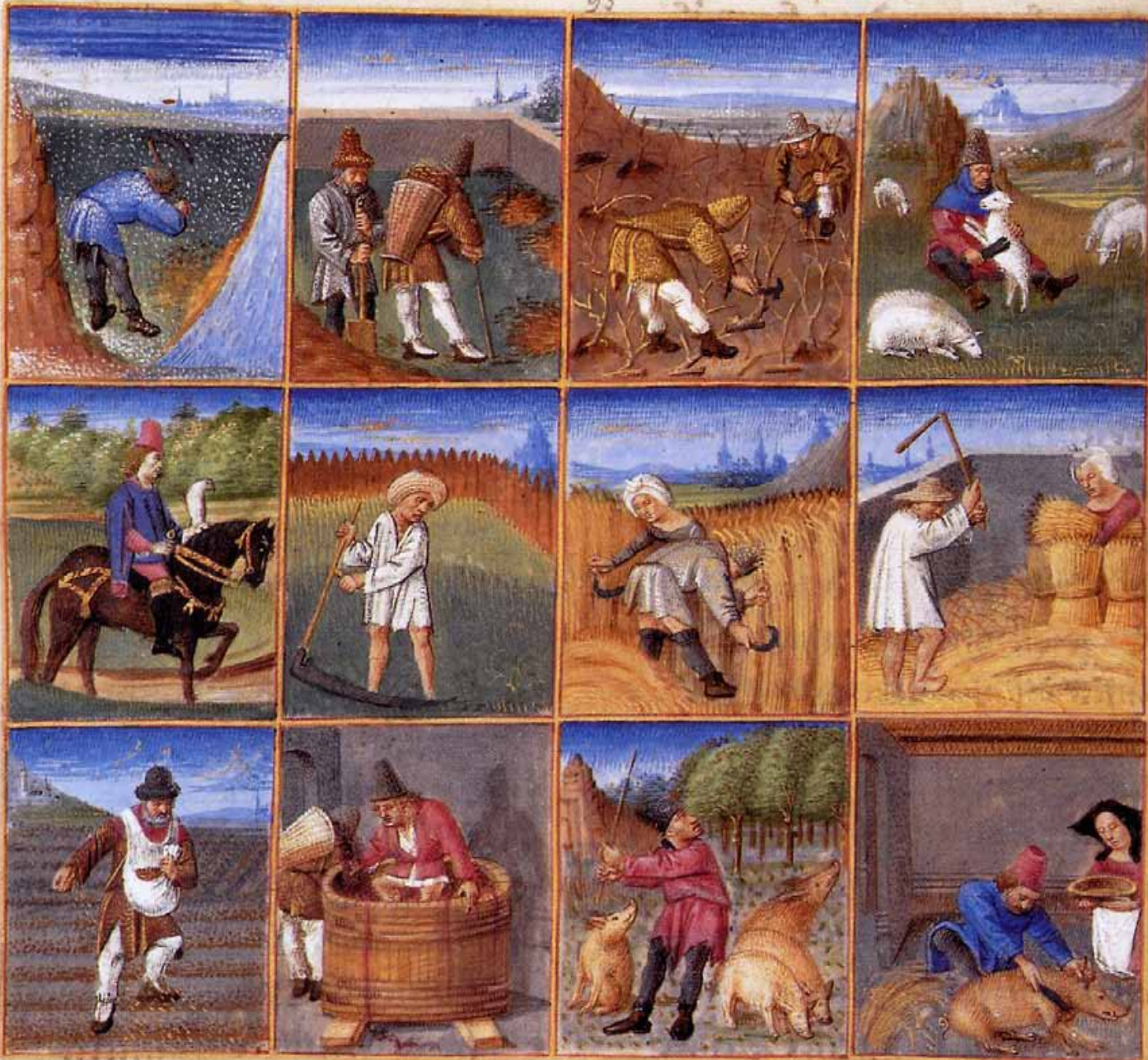
Document 8 : calendrier des travaux agricoles - le Rustican - 1365