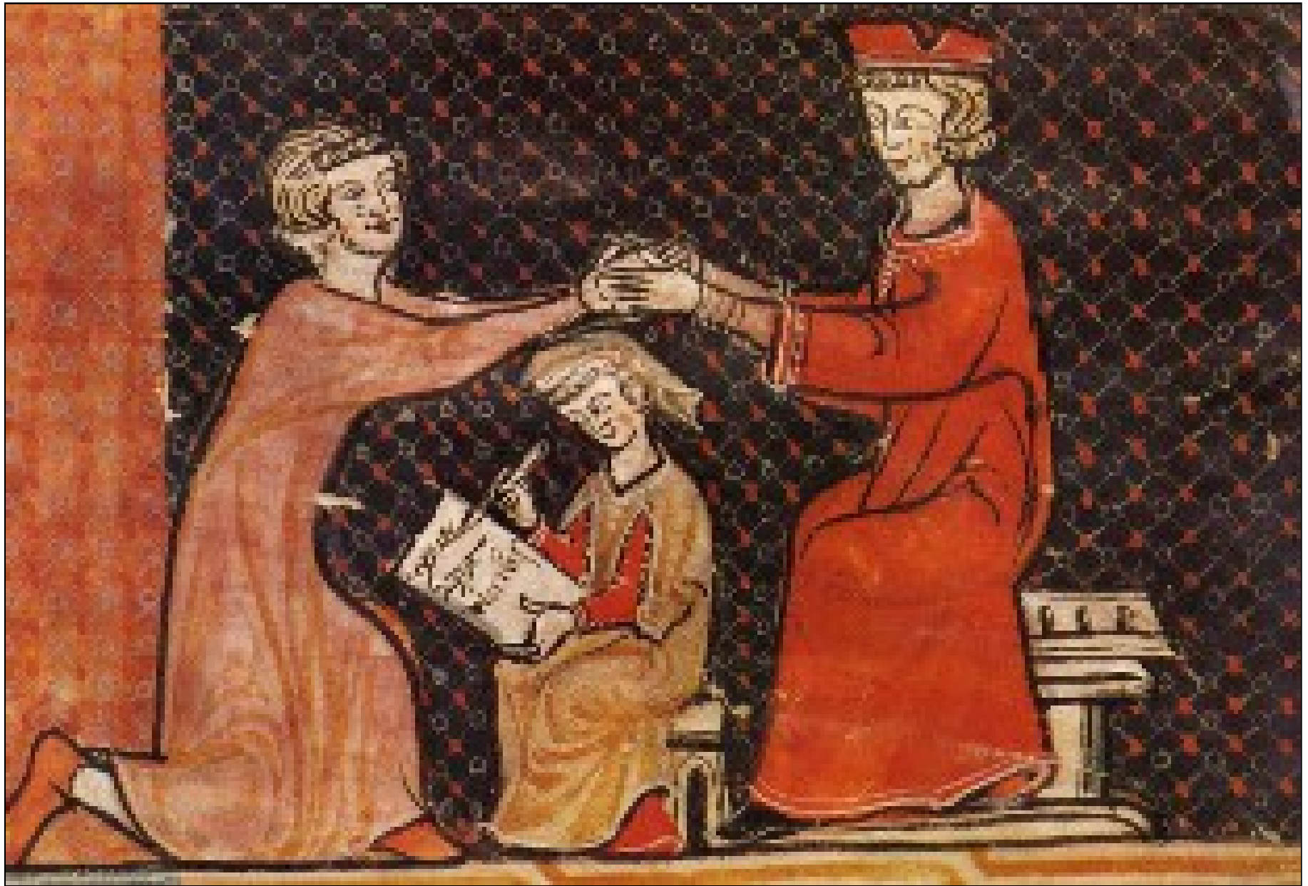
Document 1 : Cérémonie de l'hommage - enluminure