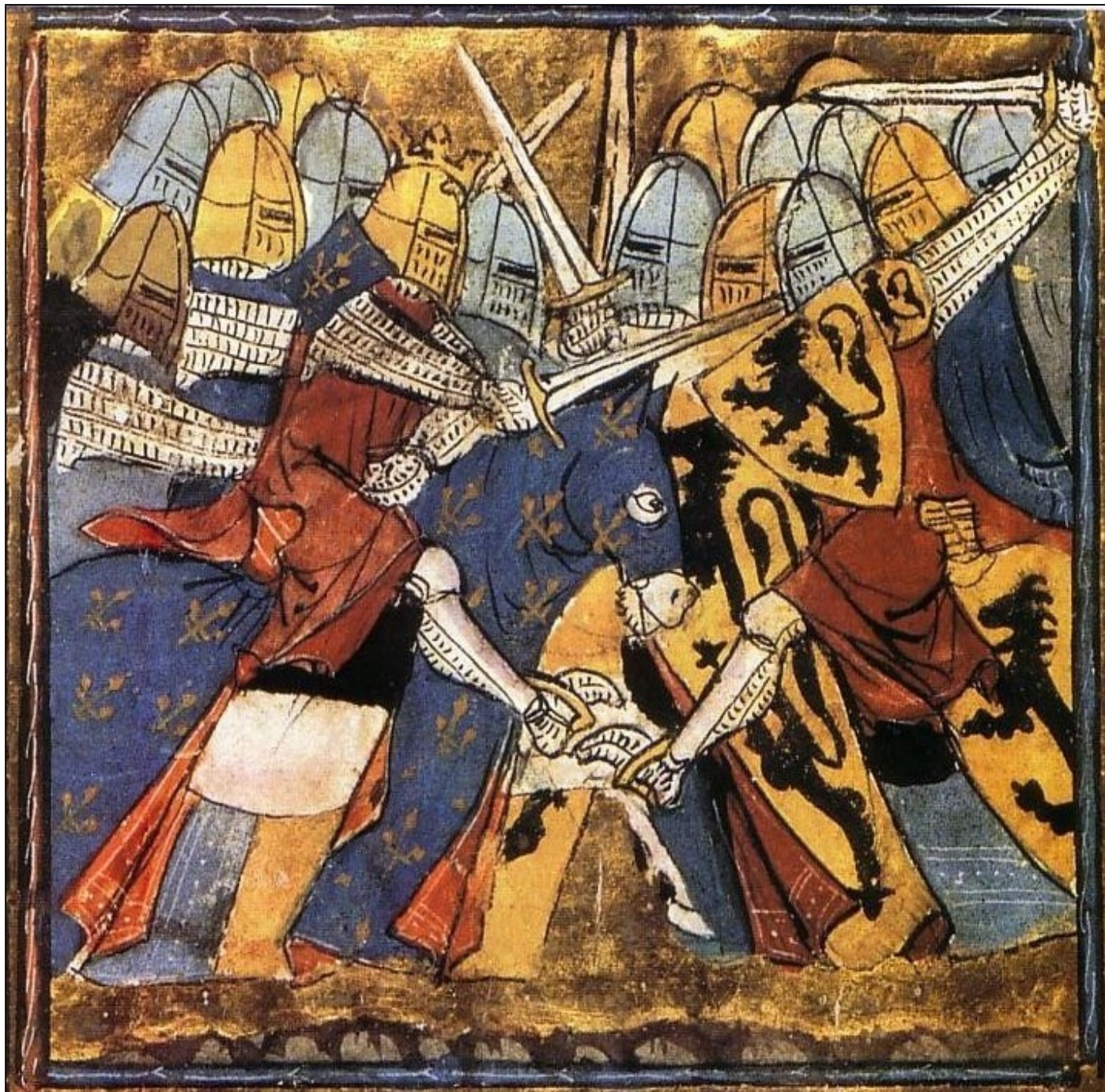
Document 4 : Chevaliers - enluminure du XIV e siècle