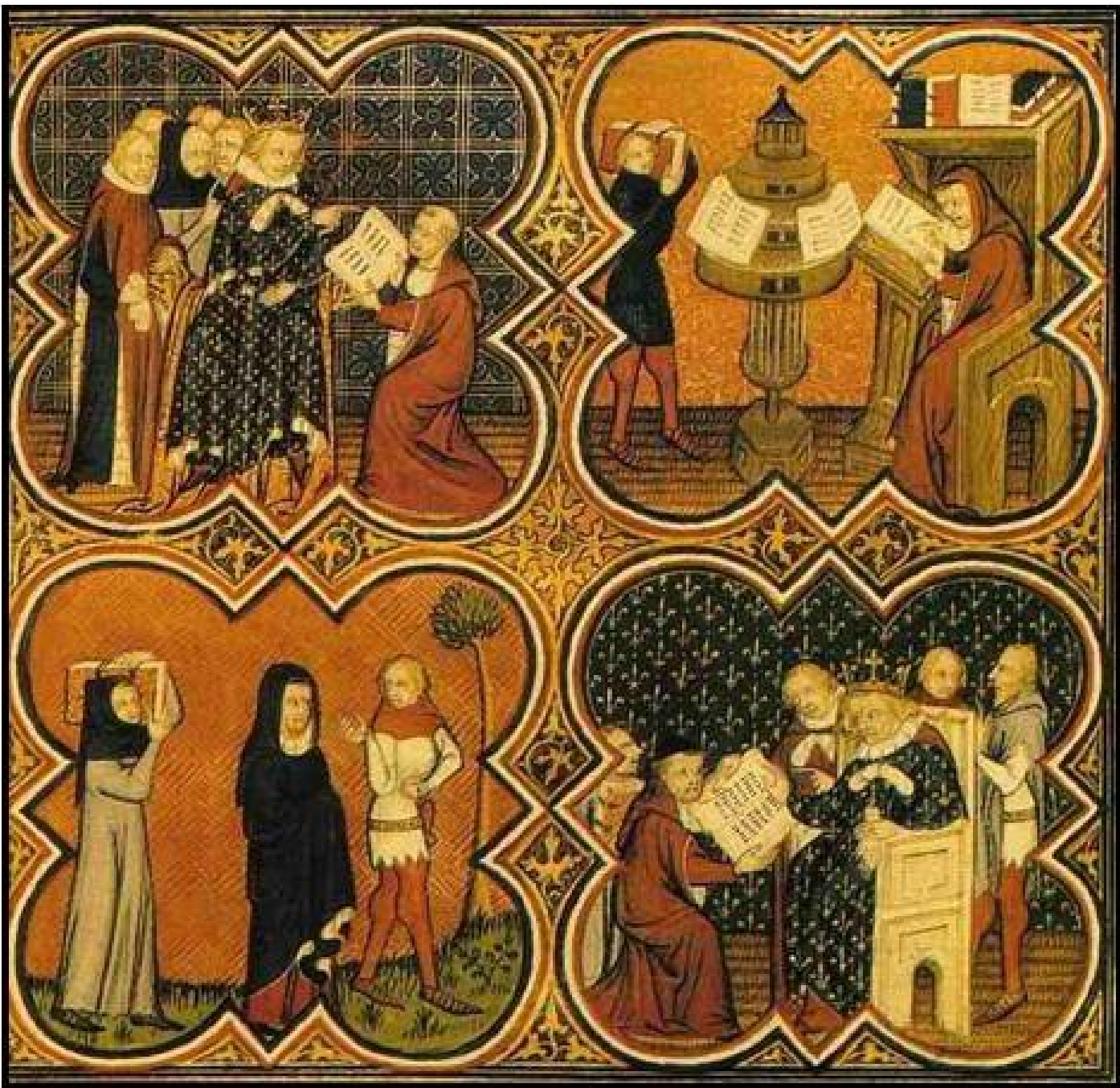
Document 7 : enluminure tirée d'un manuscrit de la bibliothèque royale de Charles V - XIV e siècle.