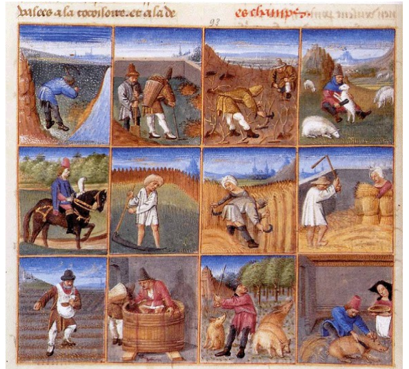
Document 8 : Qui sont ces personnages ? Que font-ils ?

Les taxes et les corvées Les paysans doivent faucher les foins. En août, ils font la moisson du blé. Ils ne peuvent prendre leur récolte qu'après que le seigneur a pris sa part. En septembre, ils doivent donner un porc sur huit. En octobre, ils paient l'impôt. Au début de l'hiver, ils doivent la corvée. A Pâques, le paysans doit donner des moutons et faire une nouvelle corvée de labour. Il doit aussi couper les arbres. Quand il va au moulin ou au four, il doit payer encore.