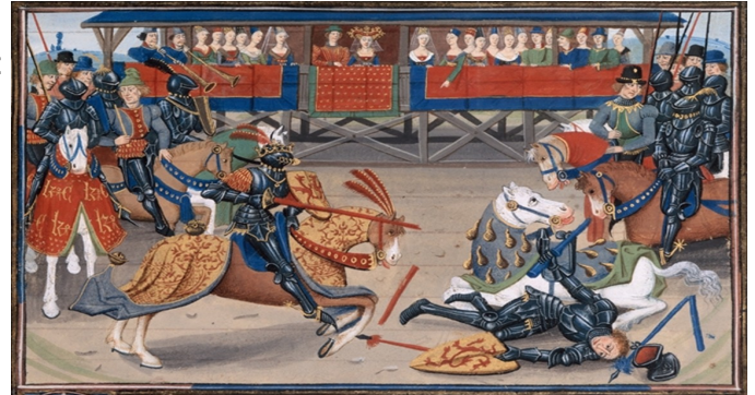
Document 6 : Décris ce que tu vois sur le document :