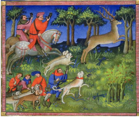
Document 5 : Décris ce que tu vois sur le document :