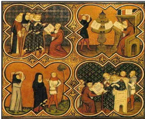
Document 7 : est-ce de dire ce que raconte cette miniature :