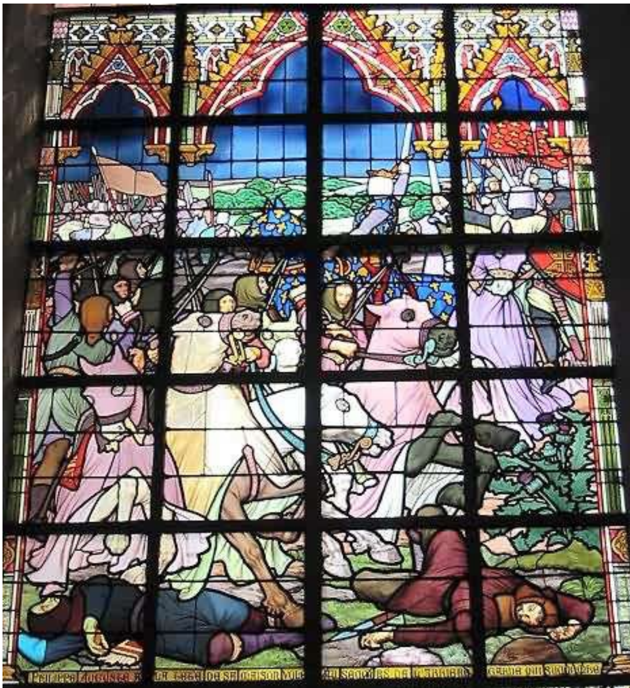
Document 6 : Vitrail de l'église de Bouvines (Nord) - 1905