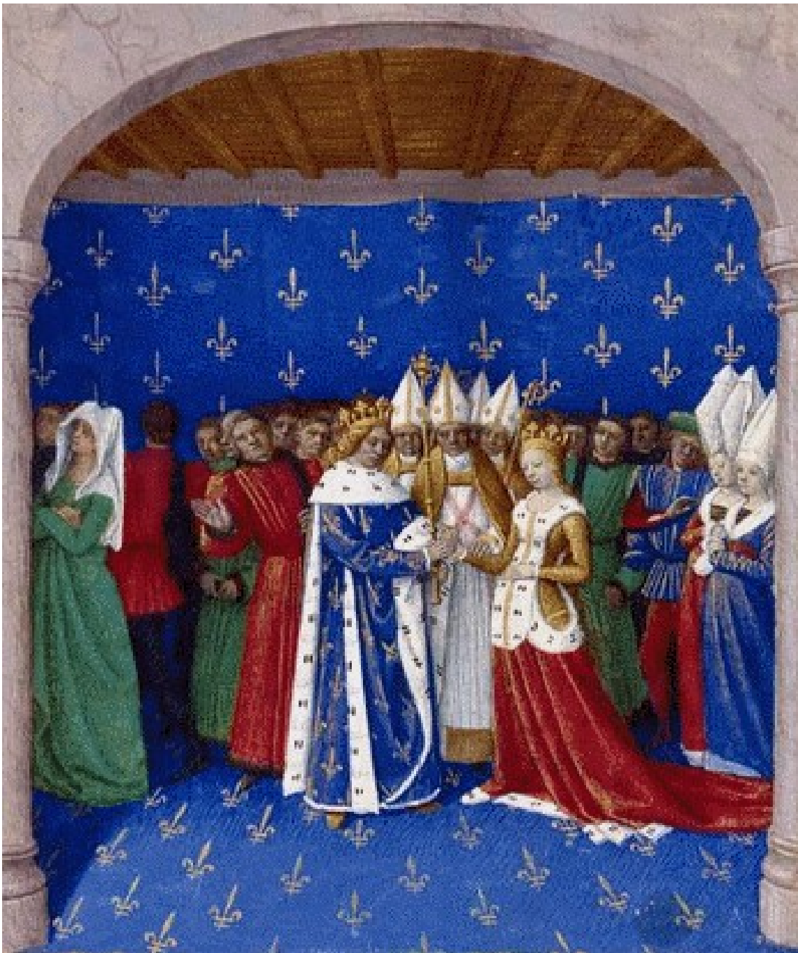
Document 5 : Mariage de Charles IV et de Marie de Luxembourg – enluminure XIV e (14 e ) siècle