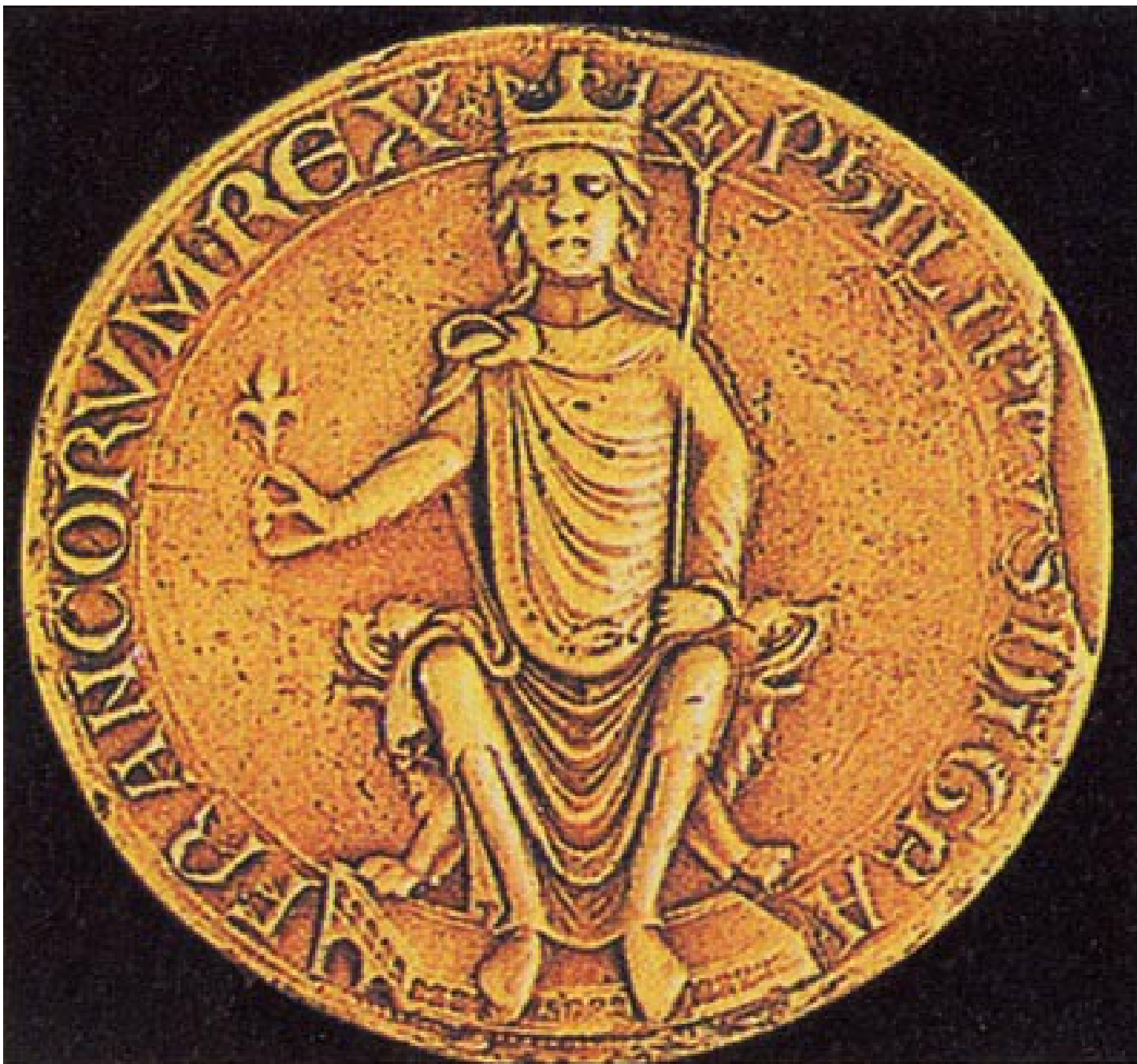
Document 7 : Sceau de Philippe Auguste (1165- 1223)