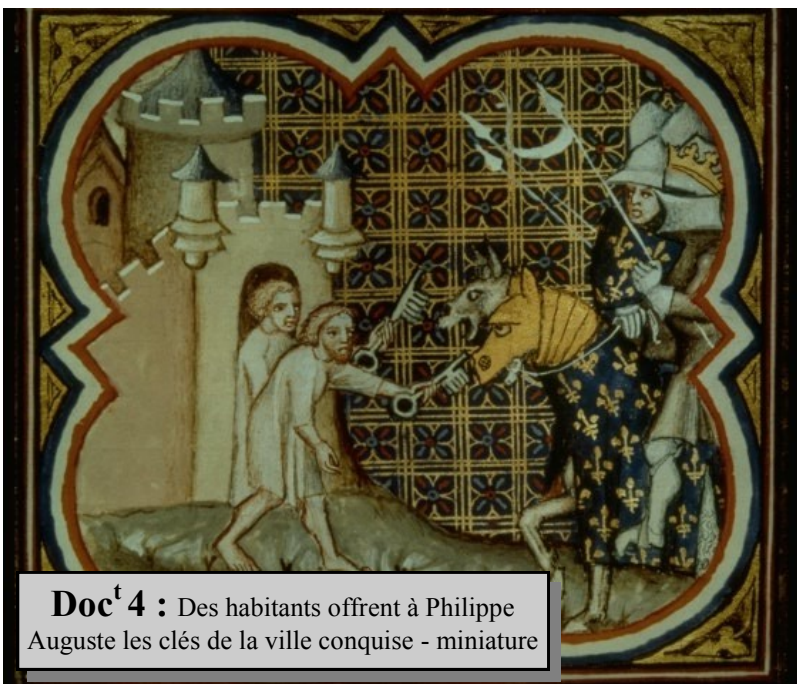
Doc t 4 : Des habitants offrent à Philippe Auguste les clés de la ville conquise - miniature

Document 3 : D'après Pierre Miquel - Histoire de la France - 1976