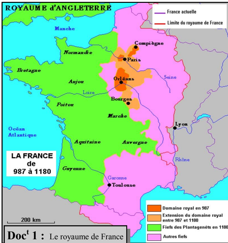
Doc t 1 : Le royaume de France de 987 à 1180 - Alain Houot