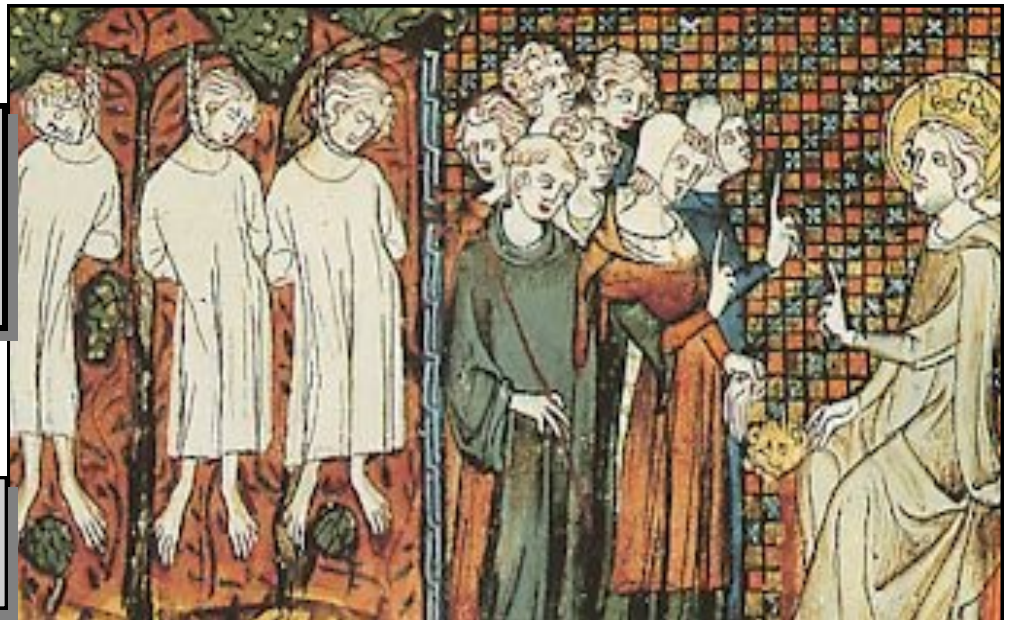
Document 8 : Saint Louis rend la justice - enluminure - 1330-1350

mai 2006, dernières modifications en juillet 2014