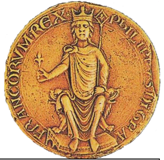
Document 7 : Sceau de Philippe Auguste