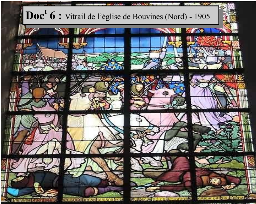
Doc t 6 : Vitrail de l'église de Bouvines (Nord) - 1905